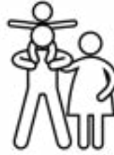
Maatii wajjiin sochii qaamaa taasisaa.