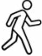
Caalatti deemaa ykn fiigaa.

Ergaan armaan gadi tokkoon tokkoon isaa karaa ittin “Si'ataa Ta'aa” jedhu bakka bu'a. Maaloo kanneen armaan gadi keessaa tokko ykn isaa ol raawwadhaa: