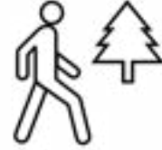
Manaan alatti miilan deemaa.