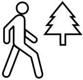
មានភាពសកម្ម។

សារដ៏មួយៗខាងក្រោមតំណាងឱ្យមួយនៃ អន្តរាគមន៍ ៨ ដែលបានណែនាំដោយអាកាសយានកិរិយាដែលមានសុខភាពល្អ។ សូមធ្វើរឿងមួយ ឬច្រើនខាងក្រោម៖