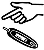
យល់ដឹងពី ចំនួនជាតិស្ករក្នុងឈាមរបស់អ្នក។