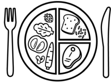
បរិភោគអាហារល្អ។