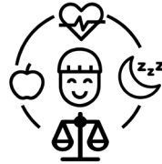
អនុវត្តសុខុមាលភាព។