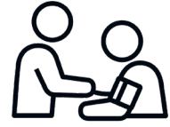
ពិនិត្យ សម្ភាពឈាមរបស់អ្នក។